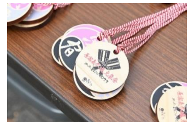
23年度個人賞メダル

○賞 … 上記会場の演舞に参加する全踊り子が対象。 会場内メダル授与所にて演舞中の踊り子に メダルを授与。